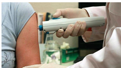
PharmaJet によるワクチンに皮下投与

モディ首相は8月20日のこのニュースに、「輝かしい偉業だ」、「インドの科学者の革新的な熱意の証明だ」と賞賛を贈っています。その投与方法もインド初で、左の写真のようにPharmaJetと呼ばれる針なし注射器を使用し、微細なジェット流で薬液を皮下注射するものです。痛み、恐怖からの解放や医療事故、廃棄物の削減に大いに役立つばかりでなく、温度管理も2~8度で可能なため運搬や貯蔵が容易です。